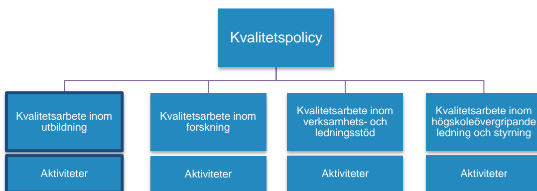
Figur 1: Struktur för kvalitetssystemet vid Högskolan i Skövde

Detta dokument beskriver kvalitetsarbetet inom utbildning.